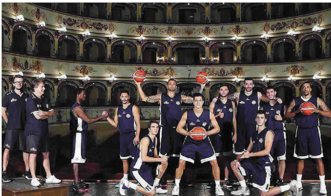
Il teatro è stata la location scelta per la campagna abbonamenti, con lo slogan "The show must go on"