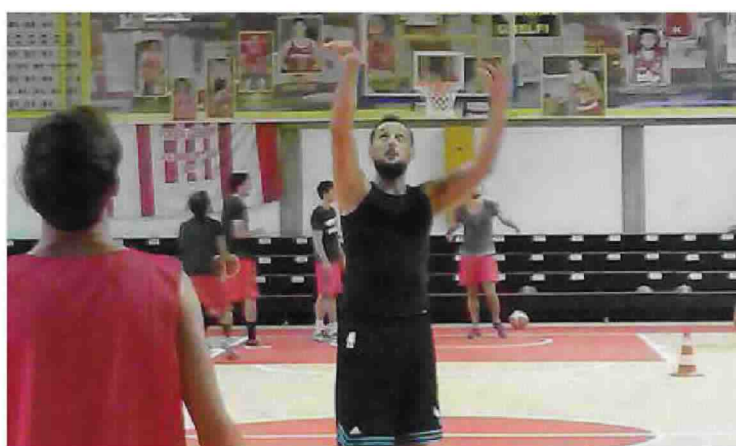
Marco Belinelli mentre si allena al Pala Ahrcos di Cento